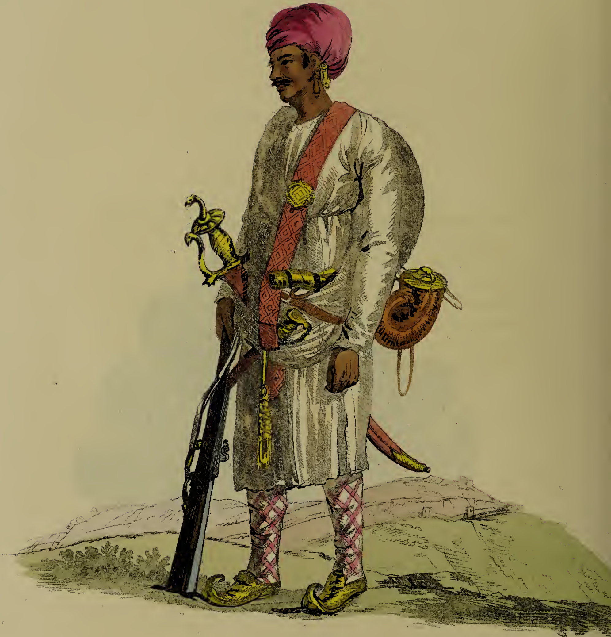
Bat' Solhyns princ. Calcutta.